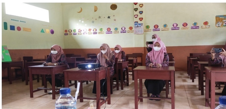
Gambar 2. Situasi rapat guru terkait pelaksanaan pembelajaran

Beberapa masalah yang dihadapi guru-guru SMP IT Daarul Istiqlal antara lain :